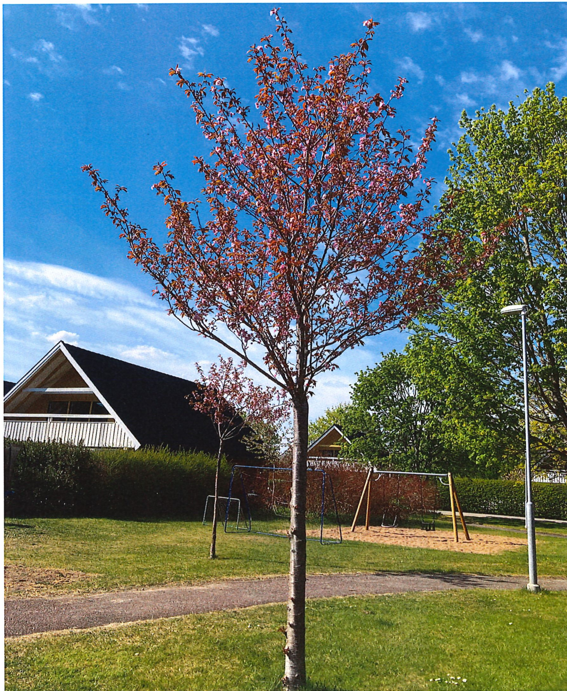
Dom japanska körsbärsträden vid UC2 maj 2023.